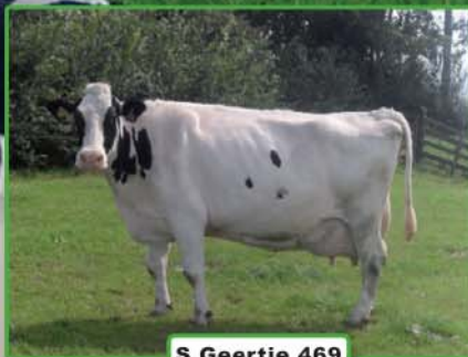
S Geertje 469